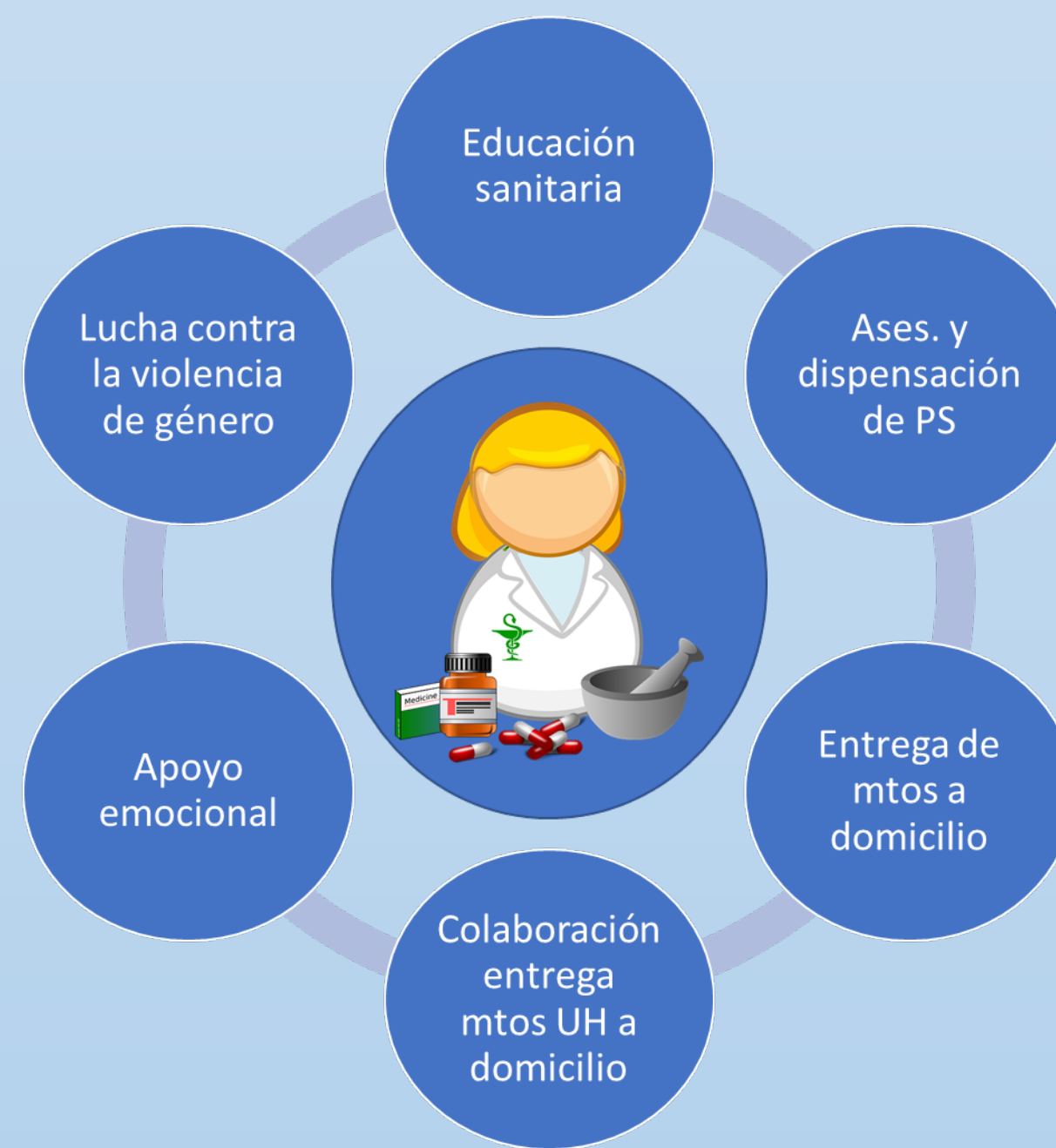
Figura 2. Gráfico de los resultados de las diferentes acciones realizadas. Ases: Asesoramiento; PS: Productos sanitarios; Mtos: medicamentos; UH: Uso hospitalario.